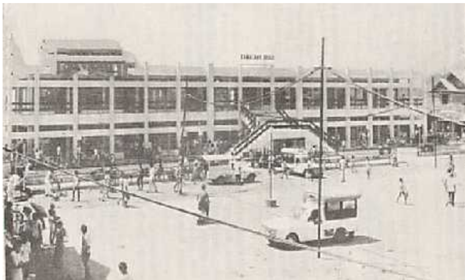
Gambar: Bangunan Pasar Gamalama Tahun 1972