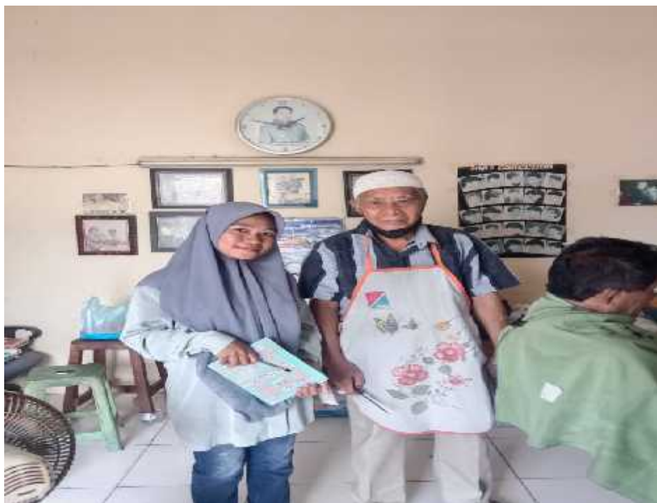
01 Agustus 2022