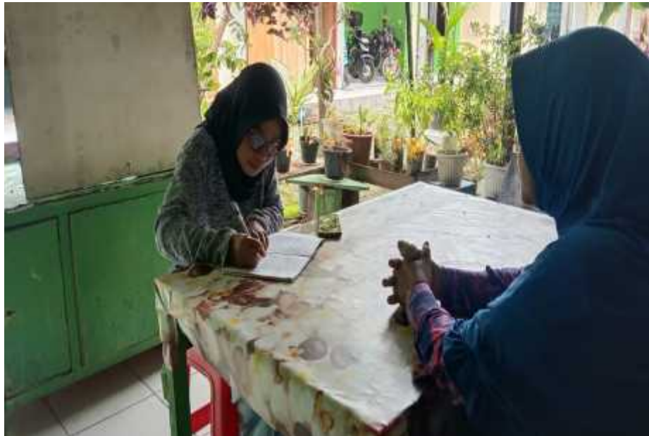
Sumber: Dokumen Pribadi 19 April 2022