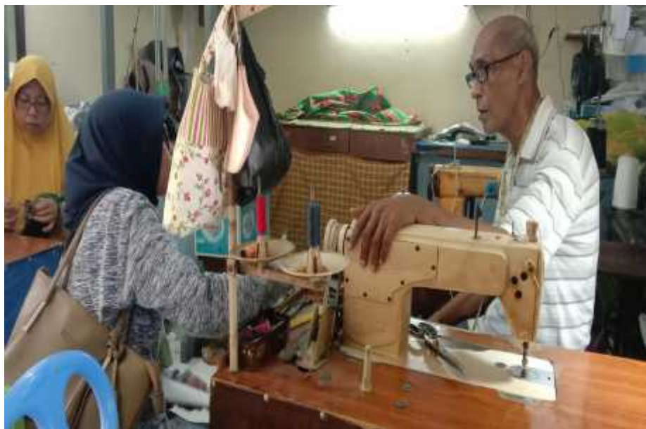
Sumber: Dokumen Pribadi 18 April 2022