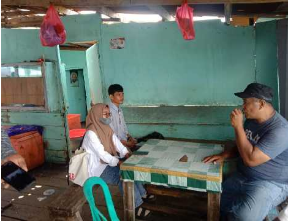
Sumber : Koleksi Pribadi 02 Oktober 2022