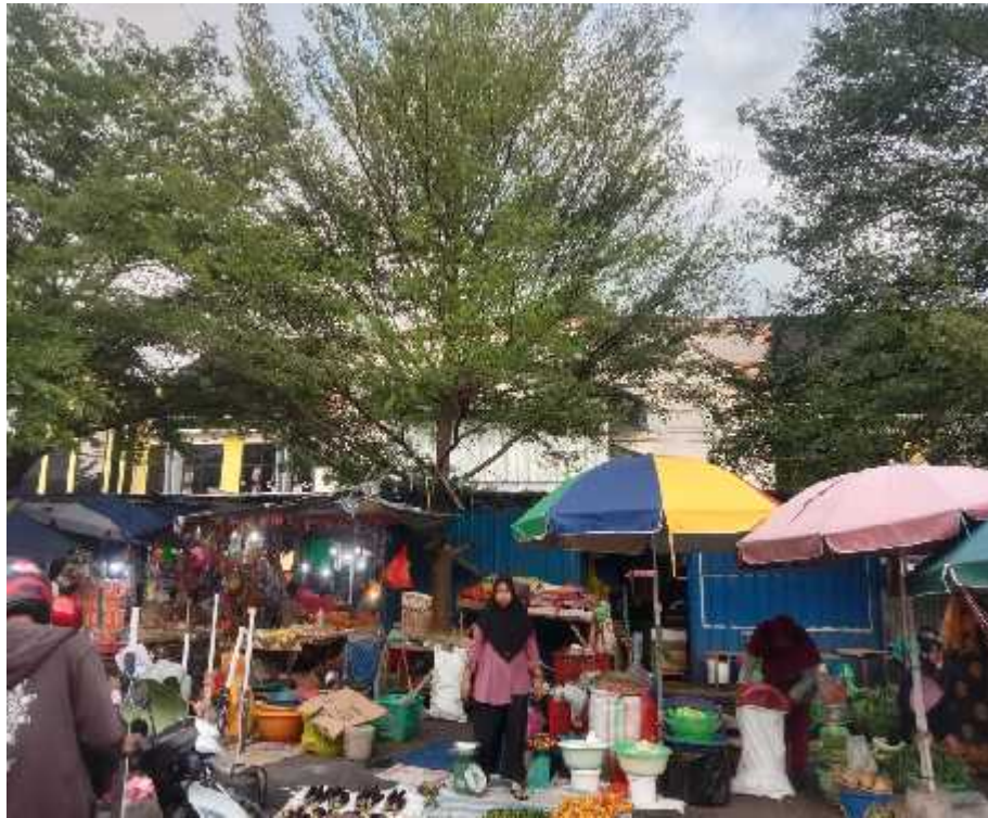
Gambar: Pasar Plaza Gamalama Modern Tahun 2023