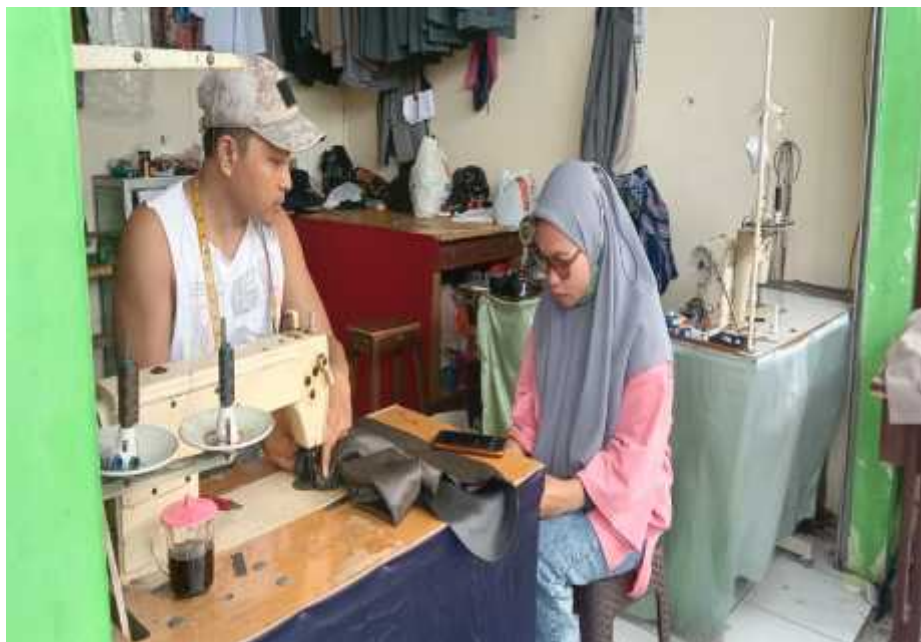
1 Agustus 2022