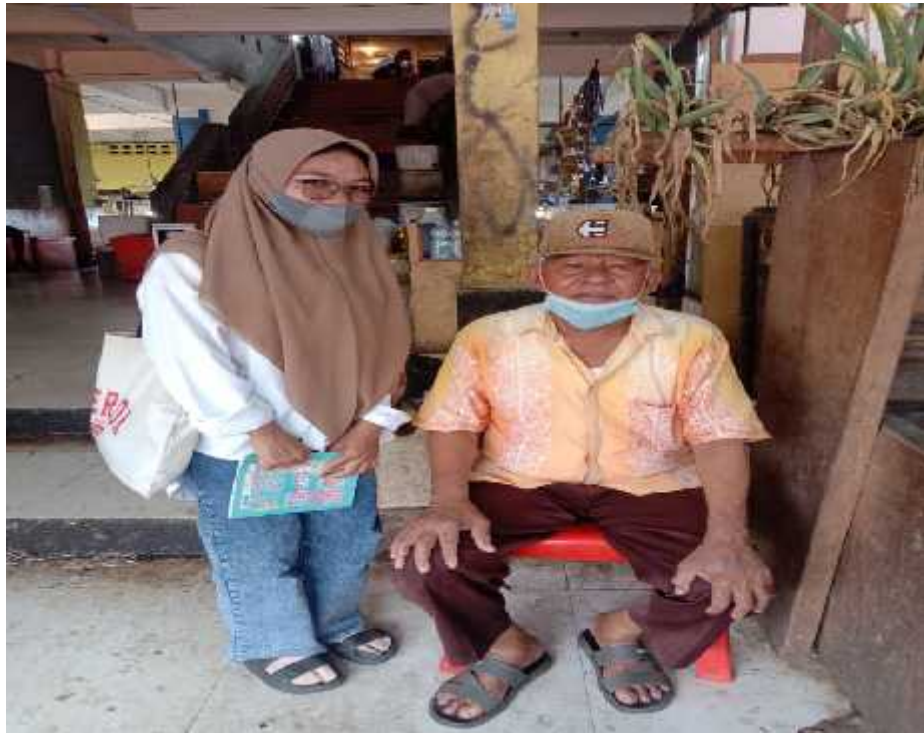
Sumber : Koleksi Pribadi 02 Agustus 2022