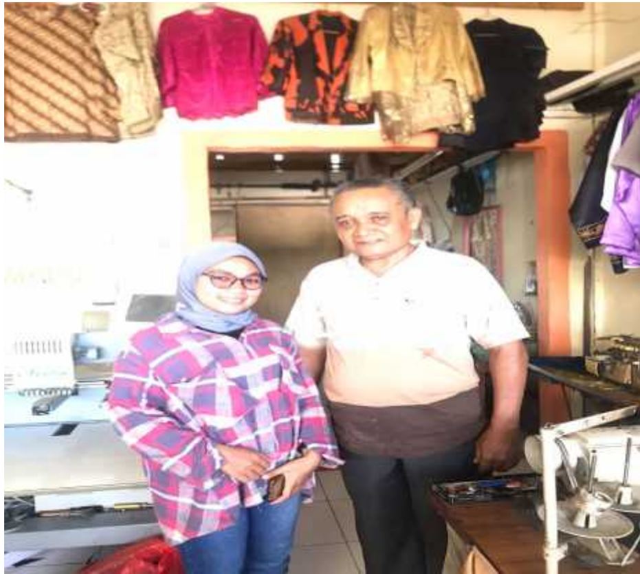
20 Oktober 2022