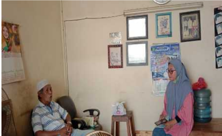
Sumber: Dokumen Pribadi 1 Agustus 2022